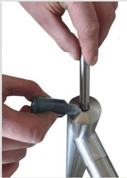
Gewindestift des Handlaufträgers mit Sicherungskleber bestreichen