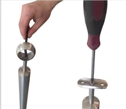
Handlaufträger Kugelring/Trägerplatte Anschrauben.