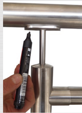
Befestigungspunkte des Handlaufes anzeichnen.