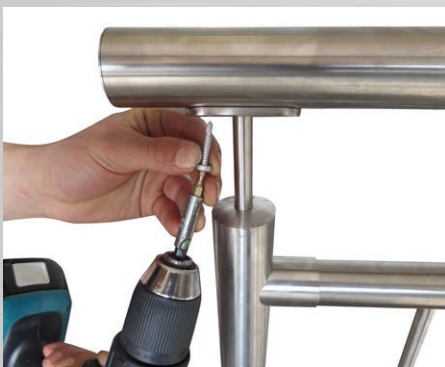
Handlauf befestigen: Bei Trägerplatte: Bohrschraube in die vorgebohrten Löcher Schrauben. Bei Kugelring: Seitliche Madenschraube Anziehen.