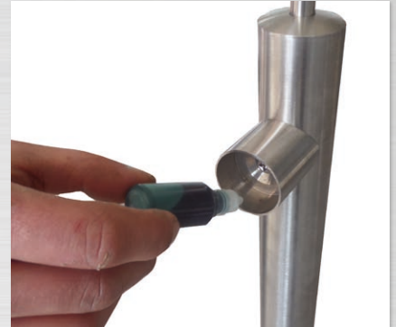
Sicherheitskleber in den Gurthalter geben.