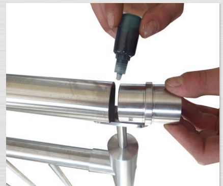
Bei Geländern über 1m Länge: Verbindungsmuffe mit Sicherungskleber bestreichen.