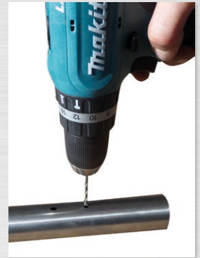
Befestigungspunkte mit 3,5mm Bohrer vorbohren.